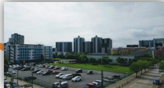
リビングからみる広がりのある景色