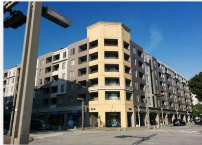
ペイタウンの中心に位置するパティオス6番街