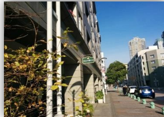
プロムナード沿いはとても便利