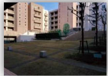
パティオは癒しの空間